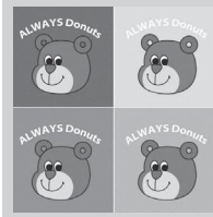
Donuts Travel / りよーどな (ドーナツ占い)