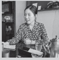
美乃莉の手相鑑定 (鑑定)