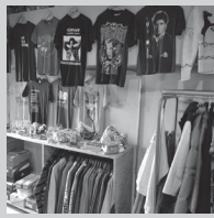
Mystery Train Vintage (古着)