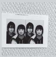
ココ店 (古着・古本)