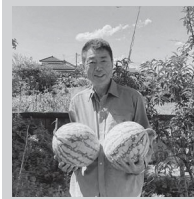
Joint Farm (源泉米おにぎり)