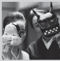
Yamazyu Girls (軽食、ドリンク)