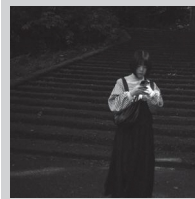
KURA COFFEE (珈琲)